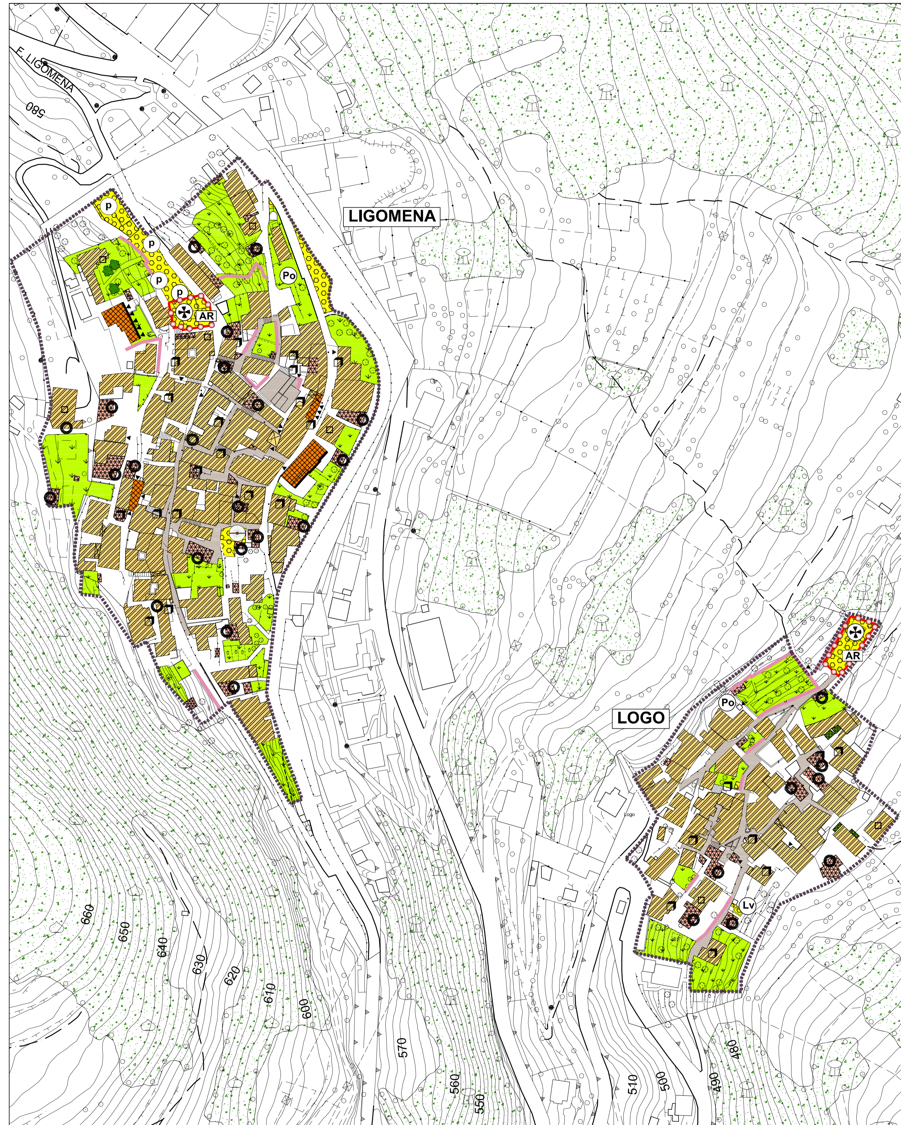
LIGOMENA - LOGO